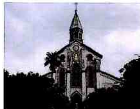
大浦天主堂(オオウラテンジドウ)