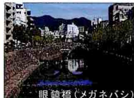
眼鏡橋(メガネバシ)